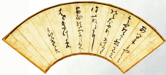
良寛遺墨『あきもやや』