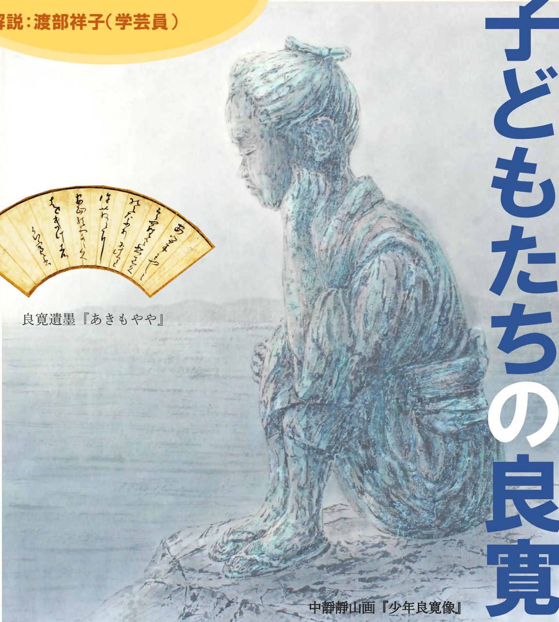
中静山画『少年良寛像』