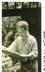
良寛にて（一九六一）年